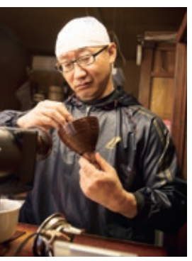
丁寧な手仕事で塗られた木製の漆器は修理ができるので、長い目でみればお得な買物です。産地では職人たちに「軒下工房」が結成され、制作現場の見学を通じた漆器のPRをしています。