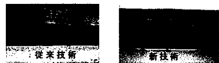
薄膜コーティング技術の腐食防止効果の向上

さらには、薄膜コーティング技術の腐食防止効果が認められ、J-PARCの磁性体コアへのコーティングに採用されるなど、食器業界以外の分野へも用途が拡大しています。