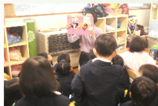
読み聞かせをする保護者

県教育委員会で、絵本の内容を簡潔にまとめたものです。参考にいただければ幸いです。