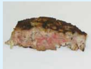
ハンバーグ(火が通っていない)