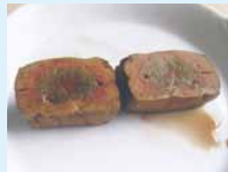
レバー(火が通っていない)