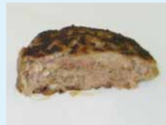
ハンバーグ(火が通っている)