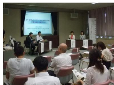
県内外企業の先進的な取組み事例紹介