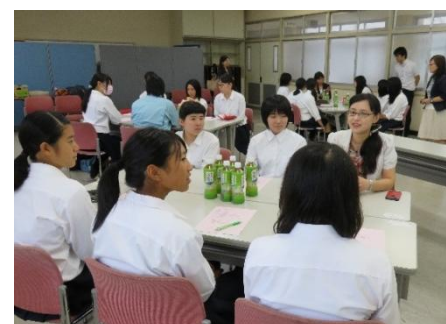
女性研究者や技術者との交流