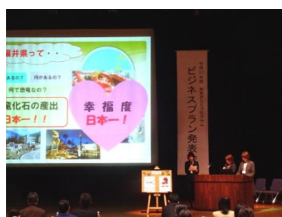
仮想プロジェクト（分析力や企画力、プレゼン力の向上）