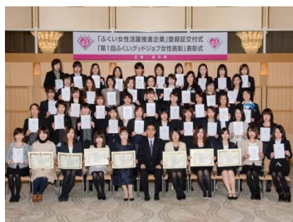
推進企業の登録証交付式・グッドジョブ女性表彰式