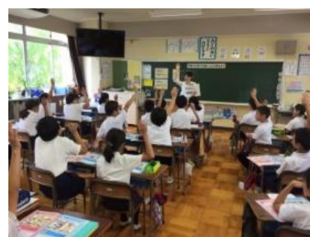
男女共同参画モデル授業