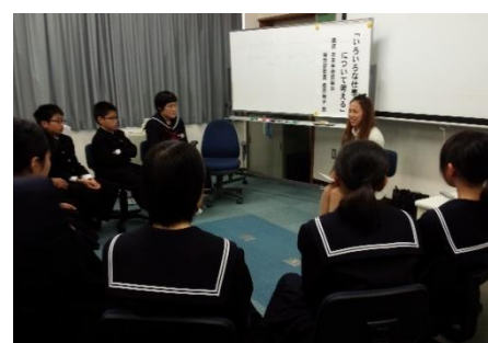
女性建設技術者による体験談