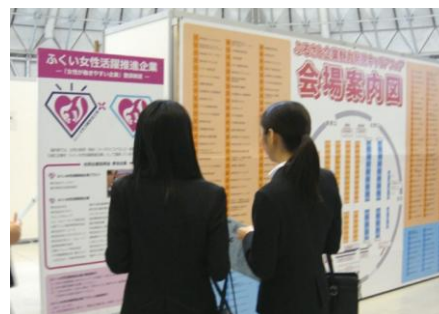
県主催合同企業説明会による企業PR