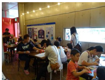
家事チャレンジ出張検定