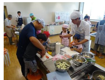
家事チャレンジ実技検定