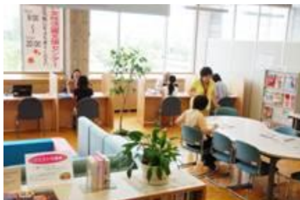
女性活躍支援センター（生活学習館内）

相談者数 (H25) 215名、(H26) 629名、(H27) 1,073名、(H28) 775名 就職者数 (H25) 1名、(H26) 38名、(H27) 88名、(H28) 71名