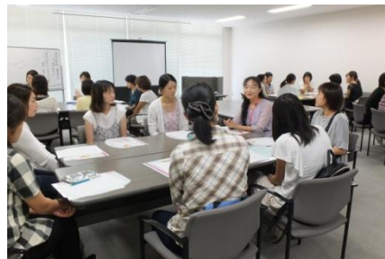
再就職セミナーの開催