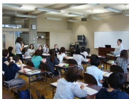
講義（女性リーダー論やキャリアデザインなど）