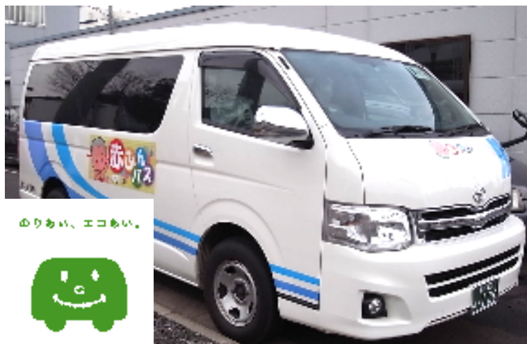
オンデマンド交通システム「コンビニクル」で運行する 「赤ふんバス」