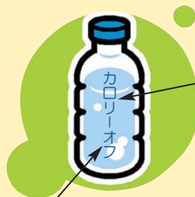
栄養成分表示 (100mlあたり)

品名: 清涼飲料水 原材料名: 糖類(果糖ぶどう糖液糖、砂糖)、塩化 Na、塩化 K、酸味料、酸化防止剤(ビタミン C)、甘味料(スクラロース) 内容量: 500ml 賞味期限: キャップに記載 保存方法: 高温・直射日光を避けてください。 販売者: ○○株式会社 △県◇市○3丁目