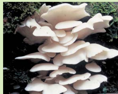
<スギヒラタケ>

従前から食用とされてきたスギヒラタケ（地域によりスギゴケ、スギタケとも呼ばれる。）ですが、食べた方が急性脳症を発症する可能性があることから、厚生労働省では、原因が究明されるまでの間、念のためスギヒラタケの摂食を見合わせるよう注意喚起しています。キノコの採取シーズンを迎えますが、いまま安全性について確認されていないことから、スギヒラタケを食べることは控えましょう。