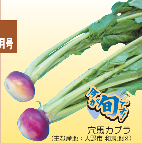
穴馬カブラ (主な産地：大野市 和泉地区)