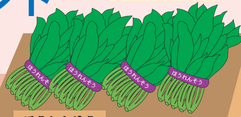
ほうれんそう 福井県産