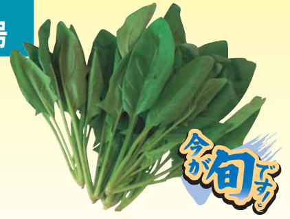
ほうれん草 (主な産地：県内一円)