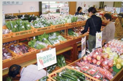
新鮮な野菜が並ぶ農産物直売所

その地域で生産されたモノをその地域で消費する…だけでなく、コミュニケーション(生産者と消費者の触れ合い)とともに農林水産物が行き来すること