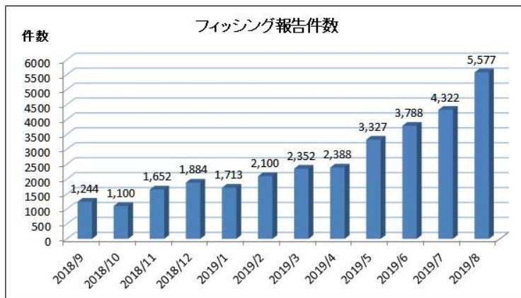
「フィッシング対策協議会」 2019/08 フィッシング報告状況より

フィッシング詐欺の報告件数は増加傾向（右グラフ）にあります。また、最近では手口が巧妙になってきており、下記のように すぐにはフィッシング詐欺であると判別できない ケースも増えてきています。