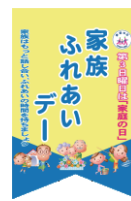
シンボルフラッグ