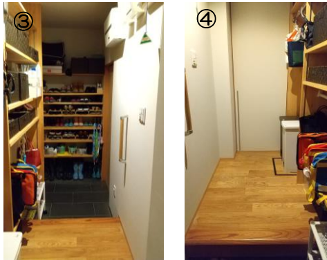
脇玄関(外部側) 脇玄関(DK側)

工夫点 脇玄関からキッチンへ直接行ける動線とし、脇玄関内に日用品収納用の棚を設けた。