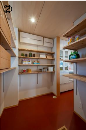
パントリー (右奥キッチン)

工夫点 玄関から直接、パントリー、キッチンへ行ける動線とし、買い物→料理の家事を軽減!