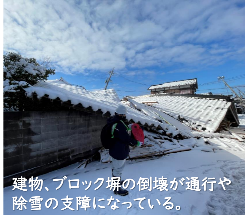
建物、ブロック塀の倒壊が通行や除雪の支障になっている。