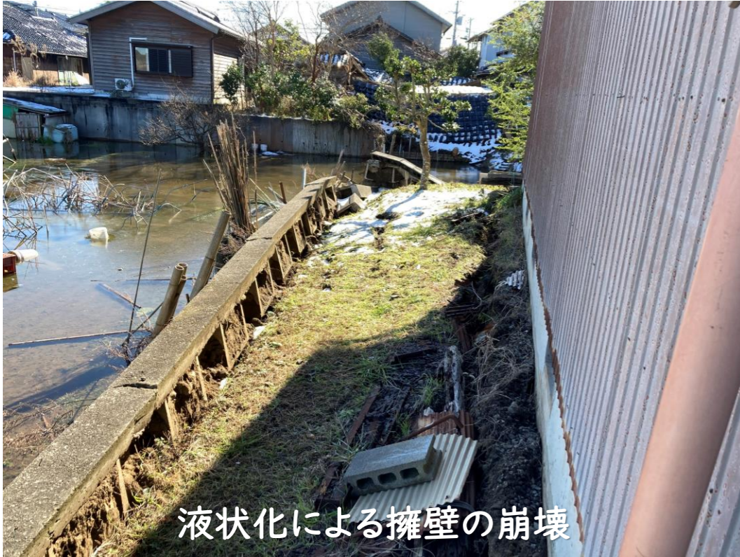
液状化による擁壁の崩壊