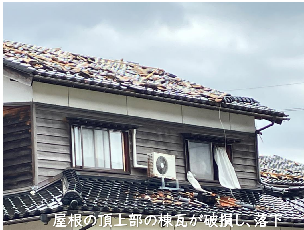
屋根の頂上部の棟瓦が破損し、落下