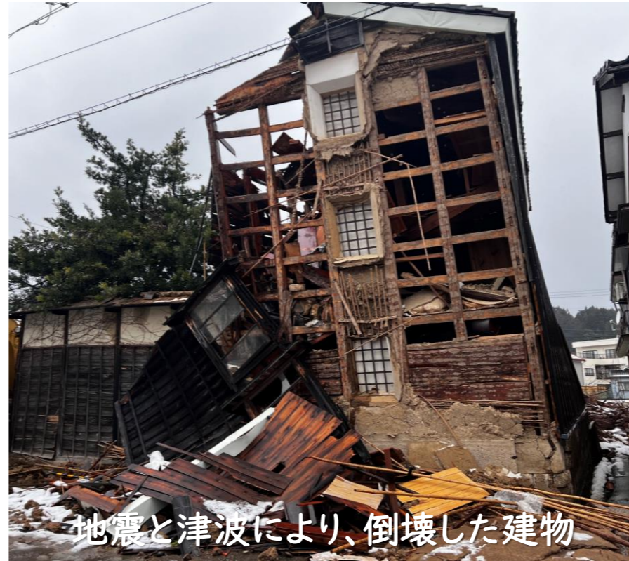
地震と津波により、倒壊した建物