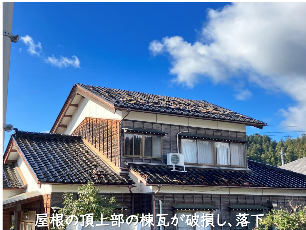
屋根の頂上部の棟瓦が破損し、落下

瓦や窓ガラスなどが落下のおそれがあると、人命に危険を及ぼす恐れがあるため、危険(赤色)と判定