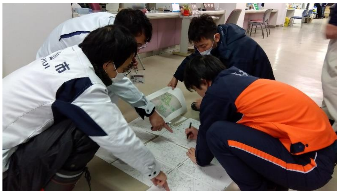
福井県・市職員が現地調査を行い、判定エリア図を作成(珠洲市)

2,575件 (珠洲市1,361件、七尾市520件、穴水町511件、志賀町183件) (石川県全体31,600件 うち約8.1%)