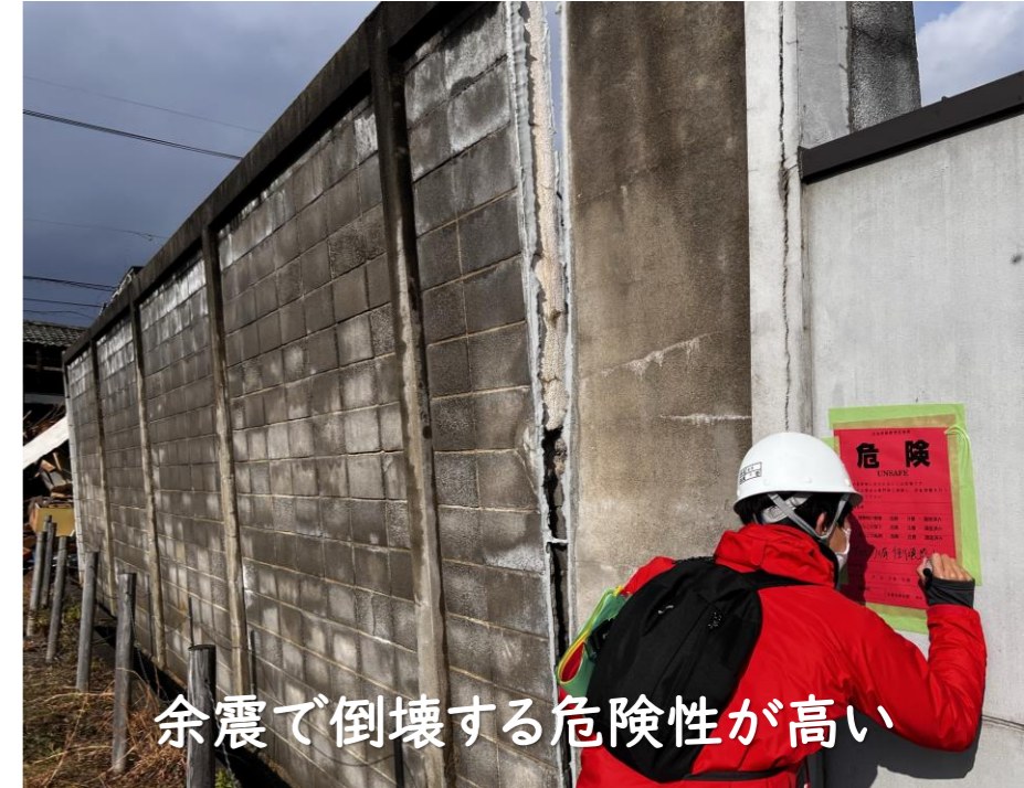
余震で倒壊する危険性が高い