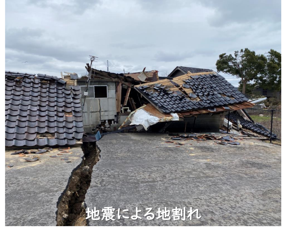
地震による地割れ