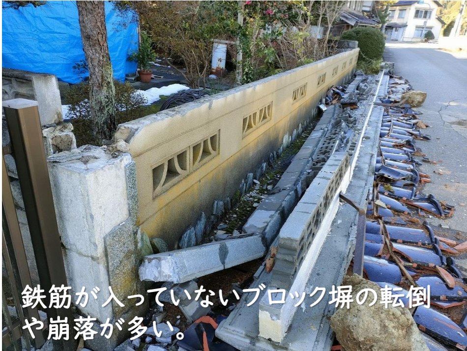
鉄筋が入っていないブロック塀の転倒や崩落が多い。