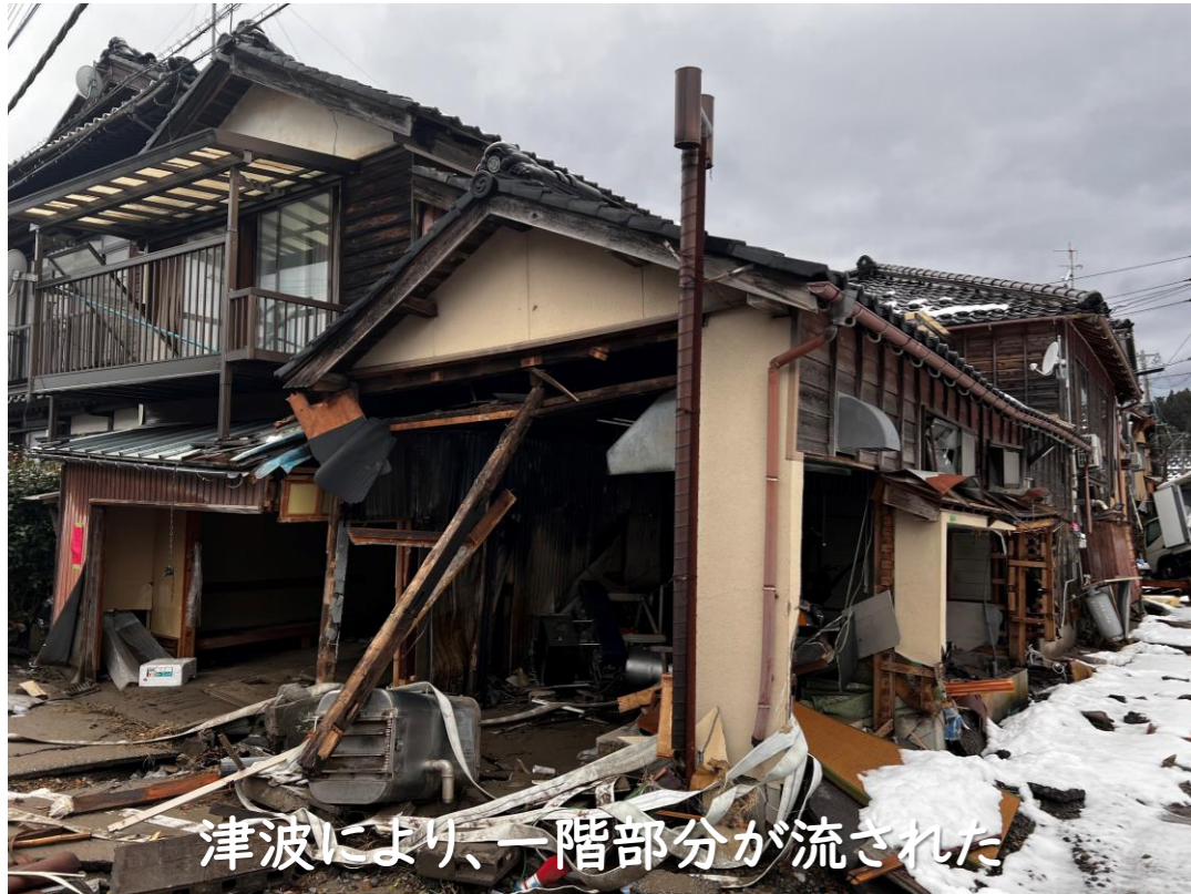
津波により、一階部分が流された