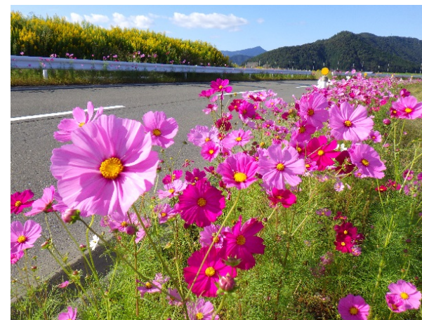
花の回廊づくり (小浜市松永)