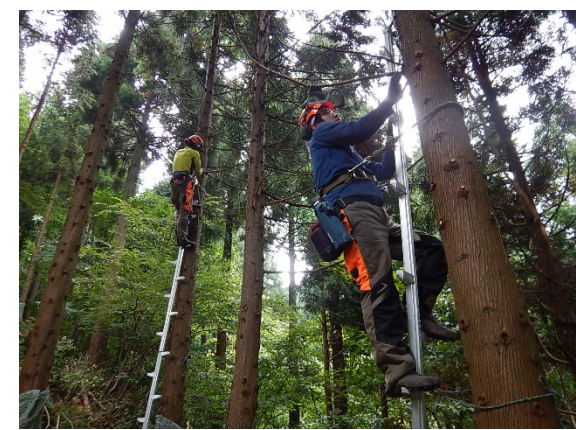
林業カレッジ研修 (福井市鷹巣)