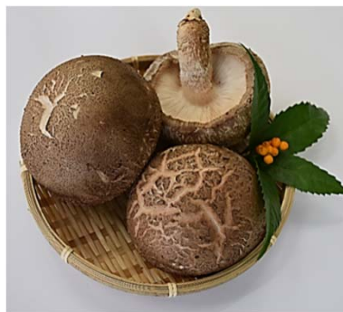
香福茸 (ジャンボしいたけ)