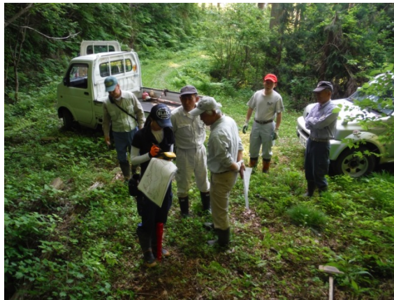
境界の明確化 (越前町笈松)