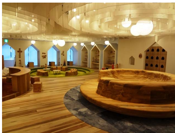
民間施設の内装木質化