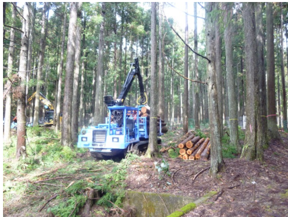
コミュニティ林業取組状況 (おおい町名田庄下)