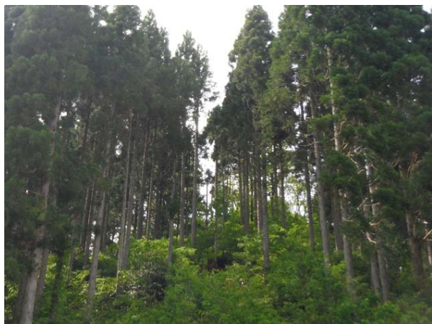
列状間伐 (越前町三崎)