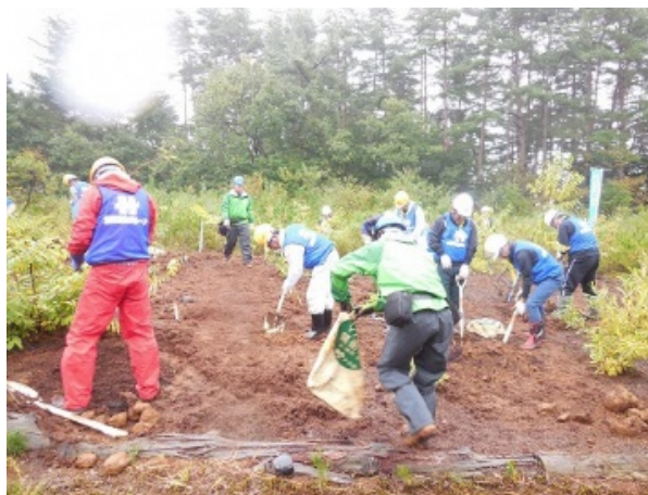
企業の森による広葉樹の植栽 (北陸電力グループ勝山雁が原の森)