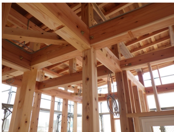
住宅での利用推進