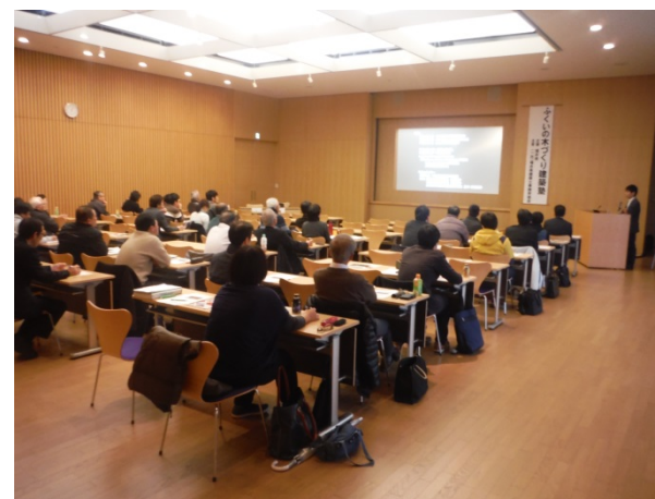
ふくいの木づくり建築塾