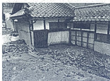
建物被害(桧尾谷町)