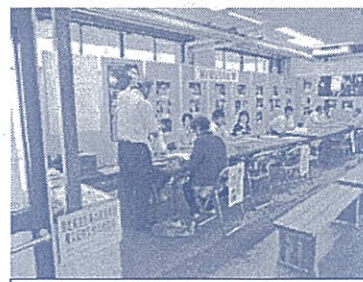
今立総合支所に設置された相談窓口