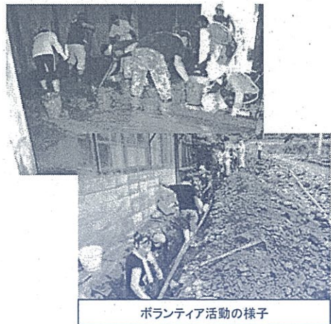
ボランティア活動の様子