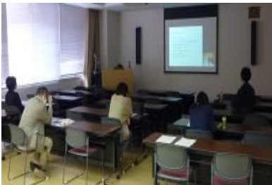
【こども療育センター研修室】