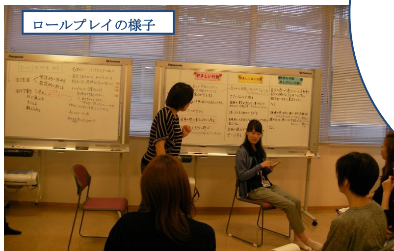
ロールプレイの様子