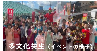
多文化共生 (イベントの様子)