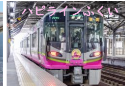
一乗谷朝倉氏遺跡博物館