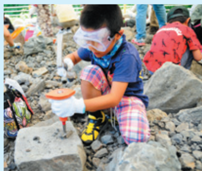
野外恐竜博物館 検索

11月3日(木・祝)まで 詳 恐竜化石発掘調査現場の間近で化石発掘体験。恐竜博物館前から専用バスに2時間のツアーです。インターネットでお申し込みください。 (バス片道30分、野外恐竜博物館体験60分) 料 大人 1200円 大高生 1000円 中小生 600円 幼児・70歳以上 無料 ※恐竜博物館本館とは別料金 問 恐竜博物館 ☎0779-88-0001