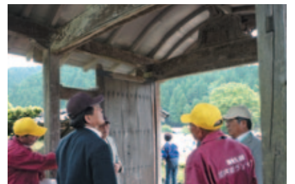
問 文化振興課 ☎0776-20-0580

詳資料館で、または国特別史跡の遺跡内で、戦国大名朝倉氏の歴史等を広く紹介する活動に参加しませんか。学習講座を定期的に開催しています。