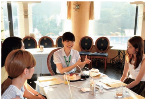
就活女子応援員と女子学生の交流会

これからも、自然を身近に感じられる環境、食べ物や水の美味しさ、子育てのしやすさ、人のつながりなど、福井の魅力を都市圏のセミナーやホームページ等でアピールし、平成31年度の目標である、「U・Iターン者数550人」の実現を目指していきます。