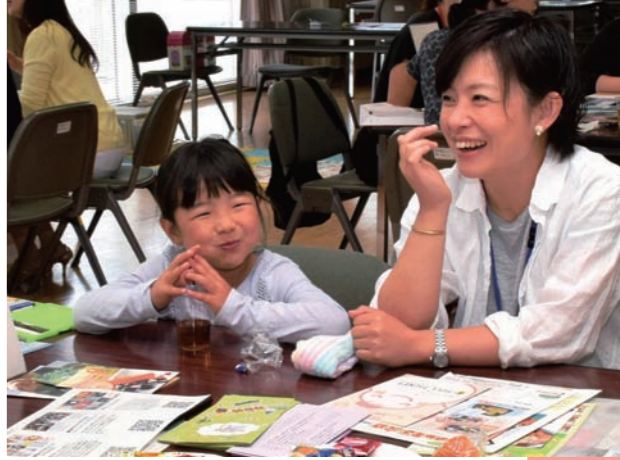
移住女性の交流会「おしゃべりCafe」