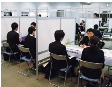
県外での合同企業説明会

の高校訪問や、合同企業説明会等への参加に係る経費を、県内企業に対し補助することにより、県外の若者を福井に呼び込みます。移住の増加と、県内の人手不足解消が期待できる試みです。