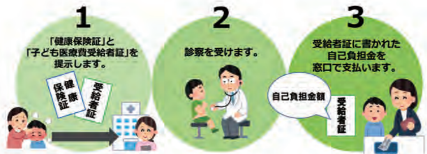
医療機関などでの流れ(4月から)

※受給者証を提示できなかった場合は、自己負担分を一旦お支払いください。後日市町の窓口で申請し、払い戻しを受けることができます。