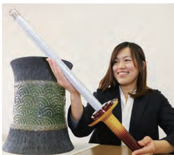
受け皿(左)と炬火トーチ(右)

各市町の炬火イベントで使われる受け皿は、越前焼。1巡目福井国体でも使われた県営陸上競技場の炬火台をもとにデザインし、側面には、日本の波や越前水仙をイメージした模様が入っています。