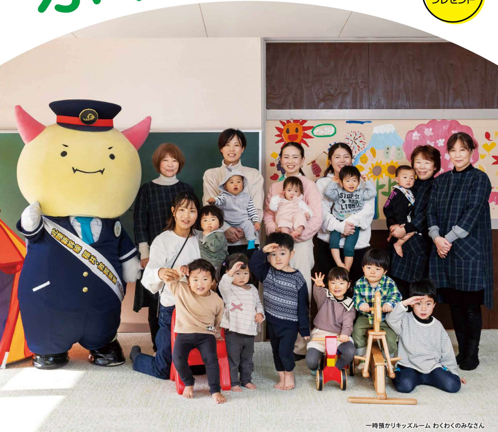
一時預かりキッズルーム わくわくのみなさん