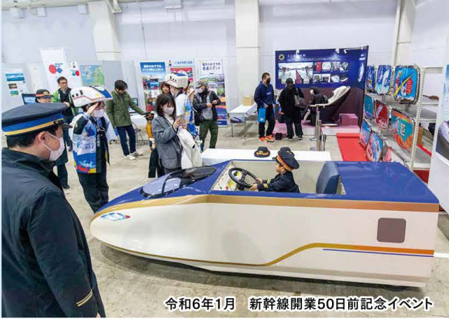
令和6年1月 新幹線開業50日前記念イベント