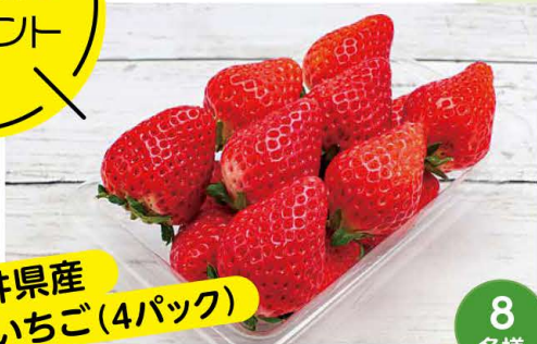
福井県産 いちご(4パック)