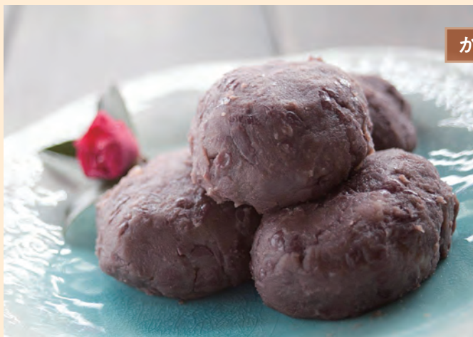
レシピ提供: (一財)越前おおの農林楽舎