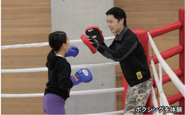
ボクシングを体験