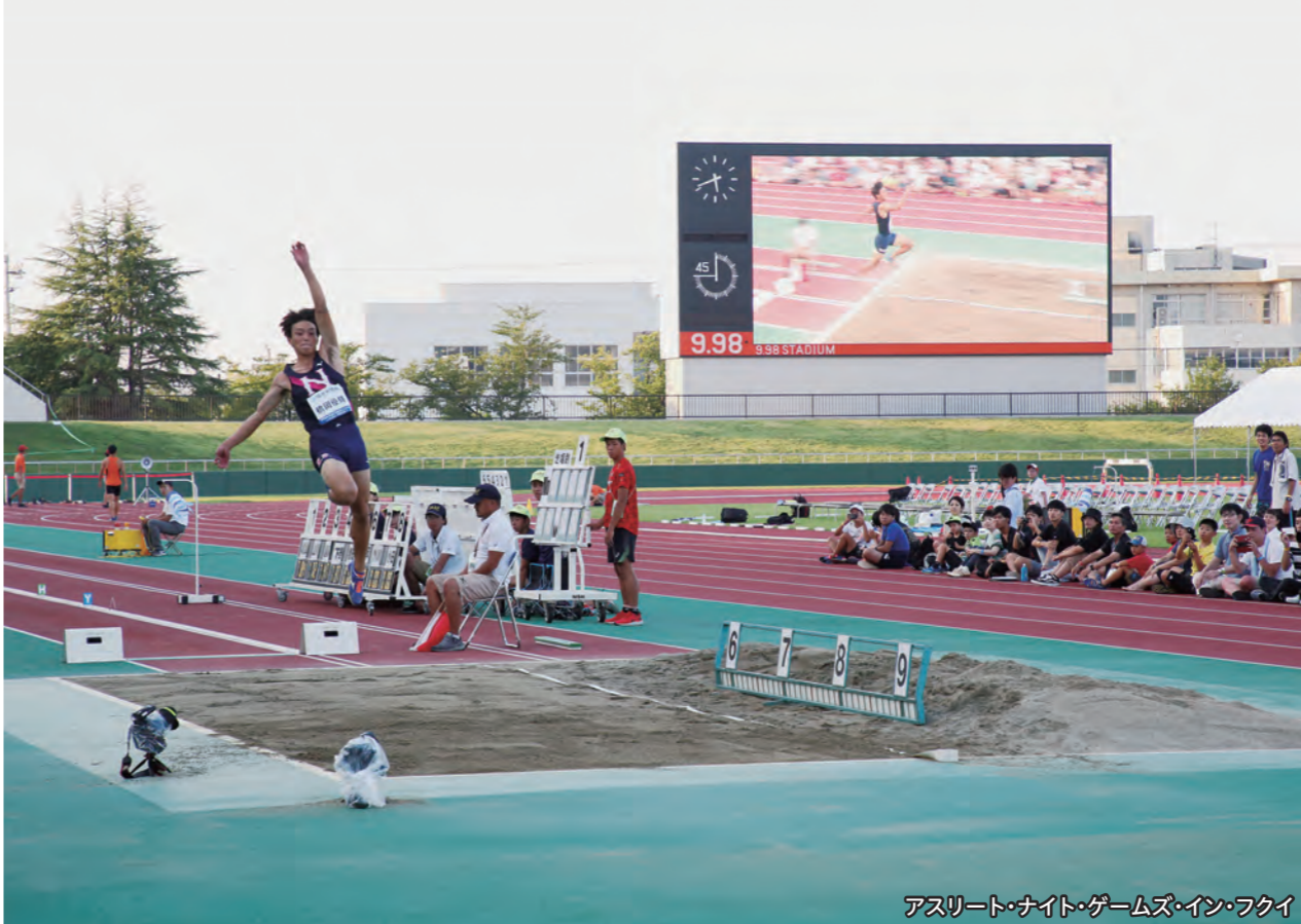
アスリート・ナイト・ゲームズ・イン・フクイ