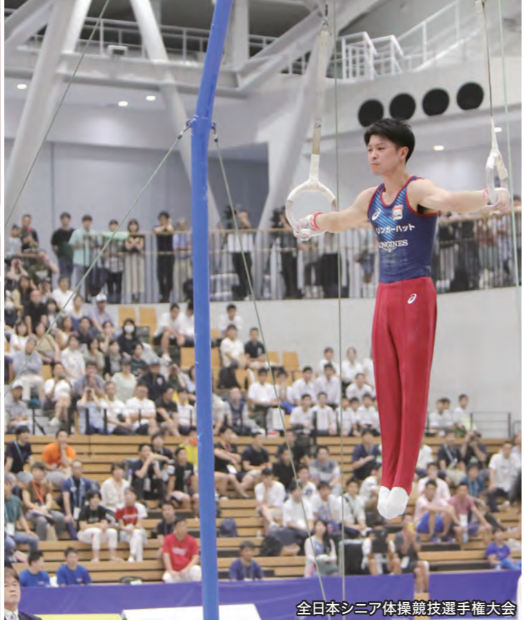
全日本シニア体操競技選手権大会