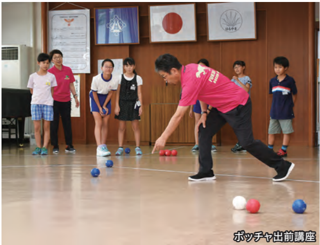
ポッチャ出前講座

県民が一丸となって成功へと導いた昨年の福井しあわせ元気国体・福井しあわせ元気大会（障スポ）。その遺産を生かし、県では、スポーツによる交流の拡大や競技力向上に取り組んでいます。