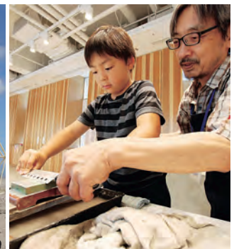
工芸ワークショップ