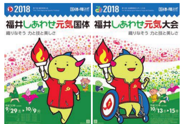
福井しあわせ元気国体・福井しあわせ元気大会のポスター

国体・障スポの公式ポスターのデザインが決まりました。国体と障スポの融合を表現するため、2枚のデザインに統一感を持たせています。マスコットキャラクター「はぴりゅう」の背景には、福井の豊かな自然を緑と青で表現。福井の特産品をちりばめ、幸せに包まれるイメージとしました。参加章と記念章は、県の花である水仙の形を、また、障スポの入賞メダルは、恐竜の卵をイメージしました。どちらも越前漆器や眼鏡など、福井の産業技術を用いて作ります。