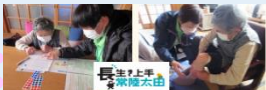
▲茨城県常陸太田市 訪問型フレイルチェック

若い人とも一緒にフレイルチェックをして元気をもらいました！！若い人を含めてフレイルチェックを広めたい！！と全国のみなさんにメッセージを送っていただきました☆