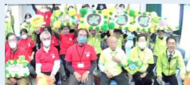
▲高知県大豊町 仁淀川町モデルの「ハツラツツ」