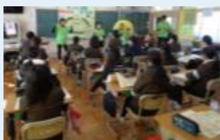
▲岐阜県安八郡広域連合 小学校でのフレイル授業