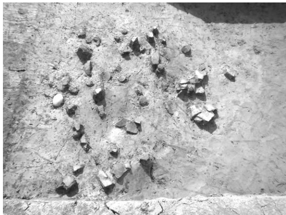
自然流路 縄文土器出土状況