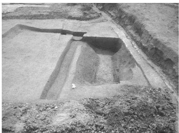
下層遺構検出状況