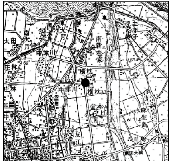
位置図 (S = 1/50,000)

調査の概要 遺跡は、東を真名川、西を清滝川に挟まれた場所にあります。全長約 700m にわたる調査区を 1～24 区に分けて調査した結果、奈良・平安時代の大きな村の存在が明らかになりました。今回は、古い道路を取り除いて 25～34 区を設定し、調査を行いました。