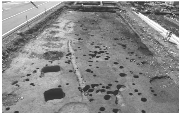
28区 大型掘立柱建物 SB1 の西側の柱列 撮影①