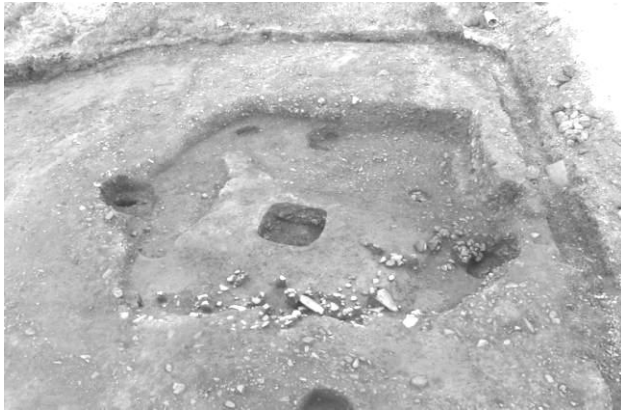
25区 竪穴住居 S11 にはカマドがあった？