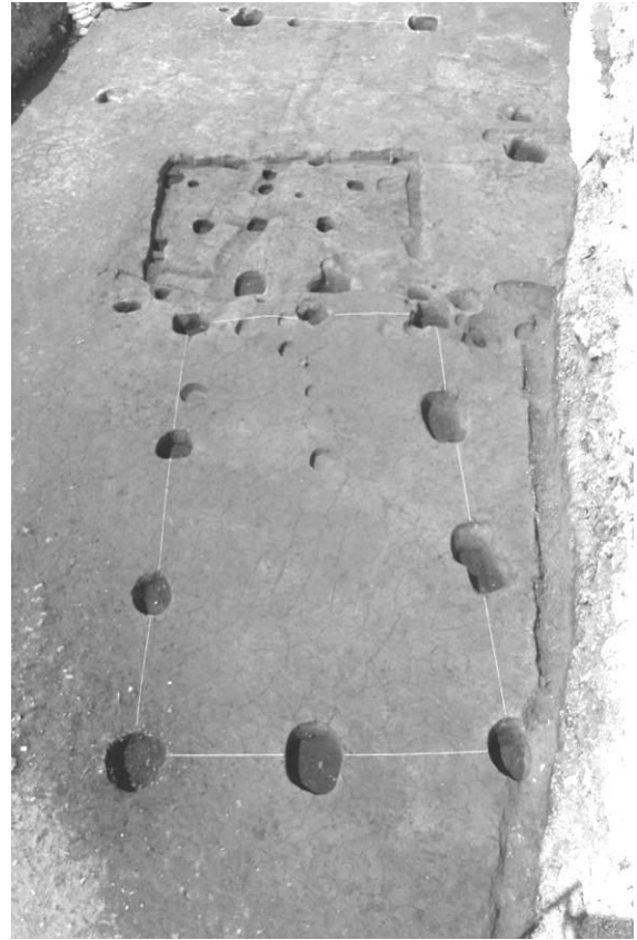
27区 竪穴住居 S11 と掘立柱建物 SB5 撮影②