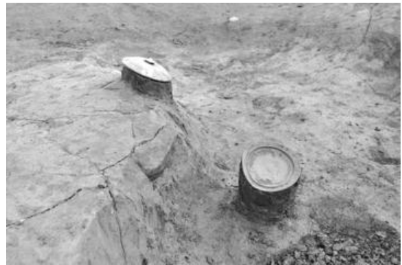
飛鳥時代の溝 遺物出土状況