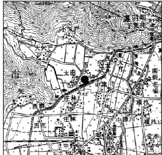
位置図 (S = 1/50,000)

所在地：大野市太田 調査原因：中部縦貫自動車道建設事業 調査期間：平成 22 年 6 月 1 日～12 月 28 日 調査主体：福井県教育庁埋蔵文化財調査センター 調査面積：2,000 m 2 時代：弥生時代・飛鳥時代