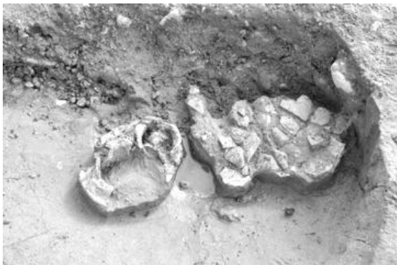
弥生時代の土坑 遺物出土状況