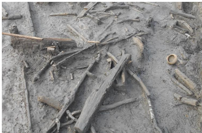
II区 河川 遺物出土状況 (西から)