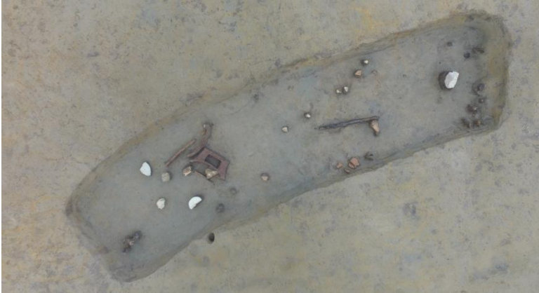
I区 平地住居周溝 遺物出土状況 (北方上空から)