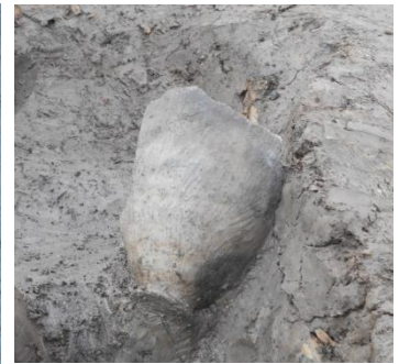
Ⅱ区 河川 縄文土器出土状況