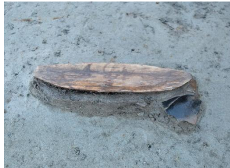
Ⅱ区 河川 舟形木製品出土状況