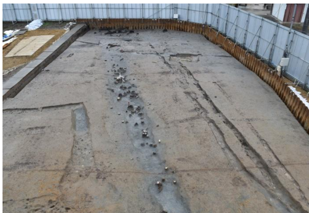
Ⅲ区 溝 遺物出土状況（北から）