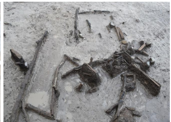
Ⅱ区 溝 遺物出土状況（南から）