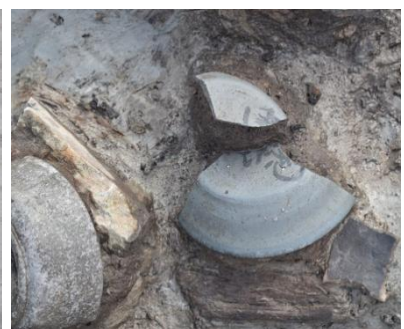
Ⅱ区 溝 墨書土器出土状況