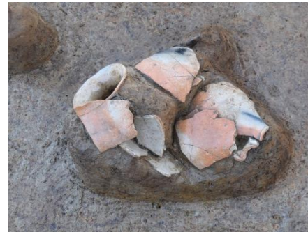
I区 方形周溝墓 土器出土状況