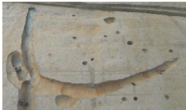
II区 平地住居 (東から)