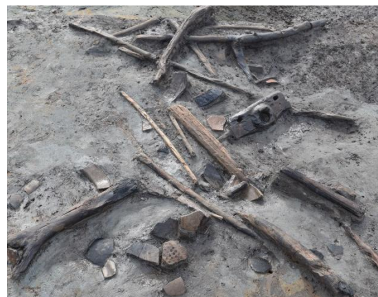
II区 河川 遺物出土状況 (東から)