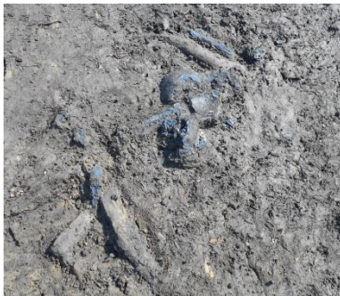
Ⅱ区 河川 人骨出土状況