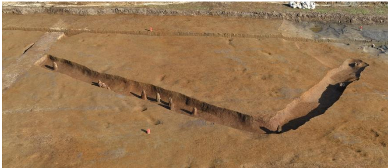
I区 方形周溝墓 (西から)