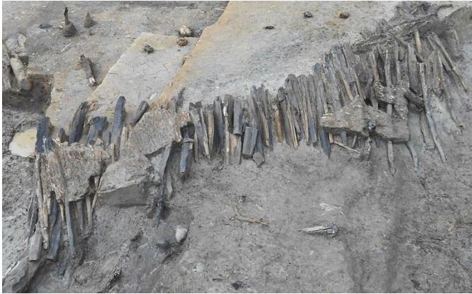
Ⅱ区 河川 護岸状施設検出状況（東から）