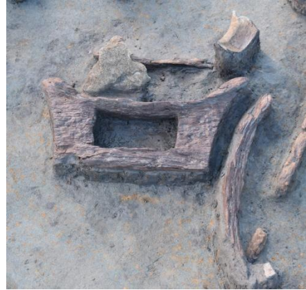
I区 平地住居 木製品出土状況