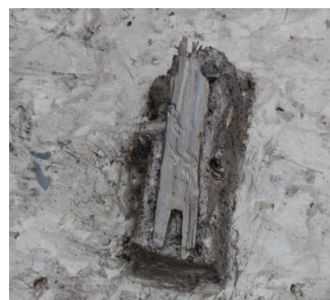
Ⅲ区 溝 人形出土状況