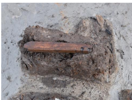
Ⅲ区 溝 火錐材出土状況