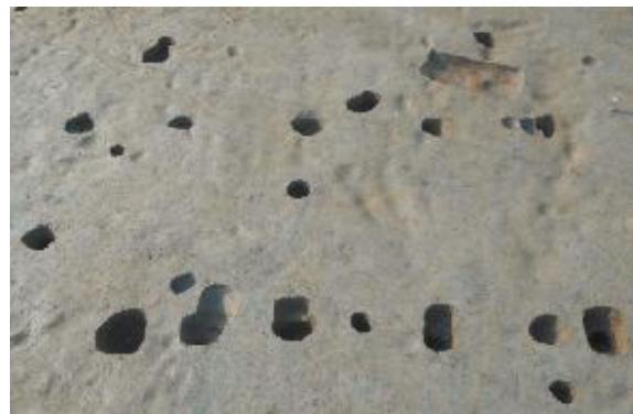
II区 掘立柱建物 (東から)