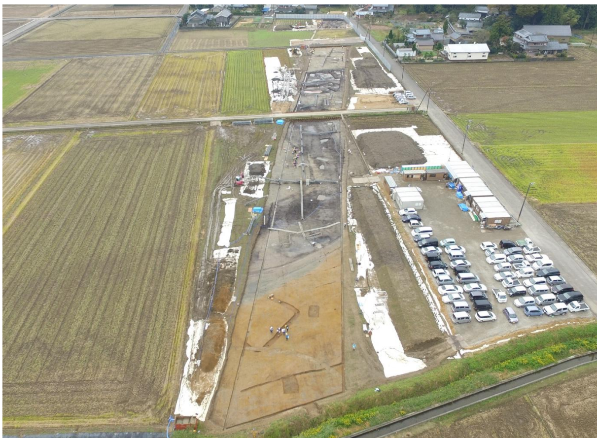
調査区全景（北方上空から）