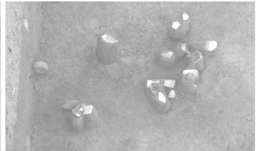
SI01 遺物出土状況（南から）