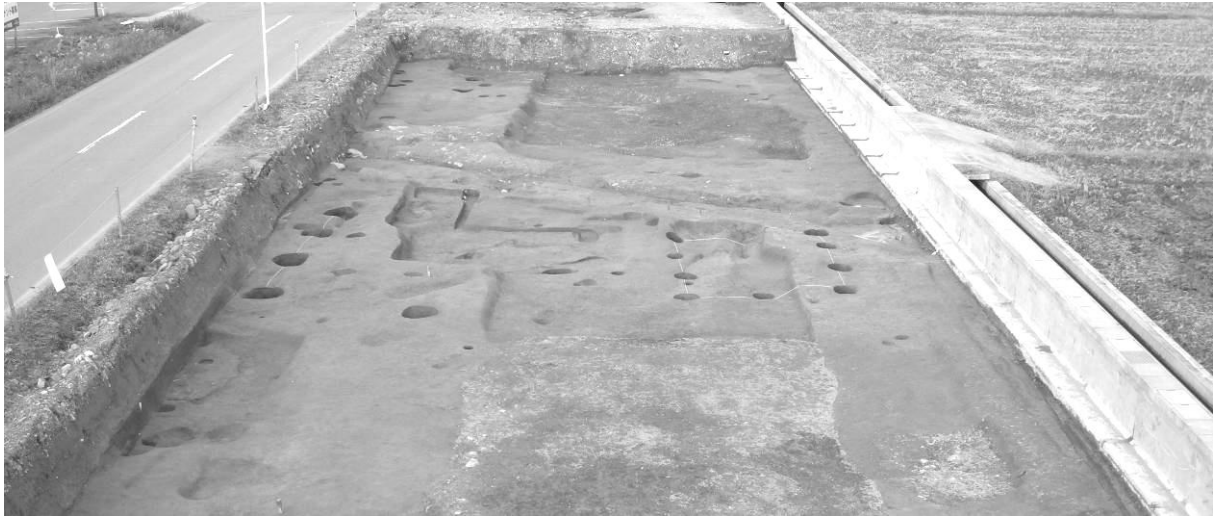
調査区北部全景（南から）