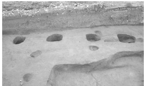
掘立柱建物：SB02（東から）