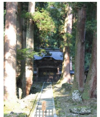
永平寺 (15:30 着予定)