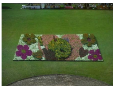
フラワーカーペット