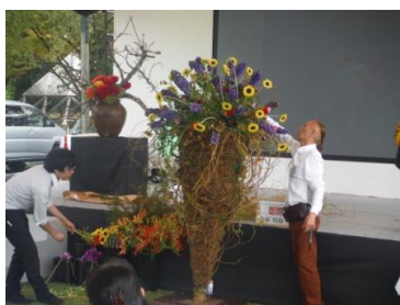
フラワーデモンストレーション