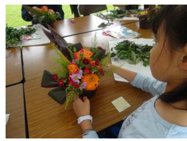
フラワーアレンジメント教室