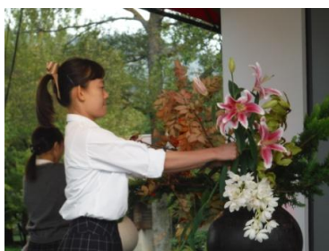
高校生花いけバトル