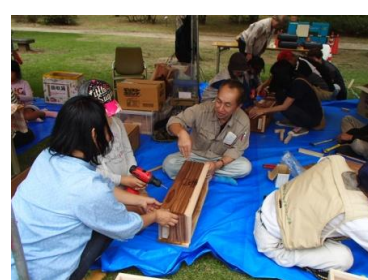
木製プランターカバーづくり