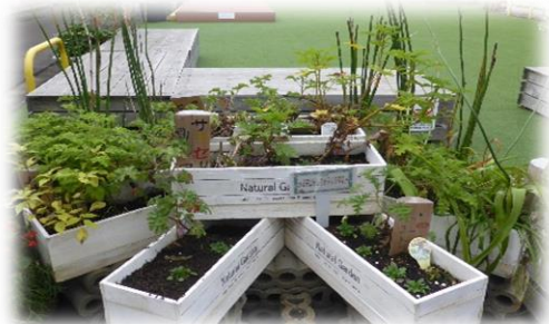
福井市新栄商店街の花壇 (プランターにビオラを植栽)

育てた花苗は、去る11月18日に越前水仙の里公園の職員に手渡され、公園内に植栽されました。また、福井駅前の新栄商店街の芝生広場「新栄テラス」にも植栽されました。寒い冬が待ち構えますが、じっと耐え、雪が解けることには多くの花をつけてくれることでしょう。