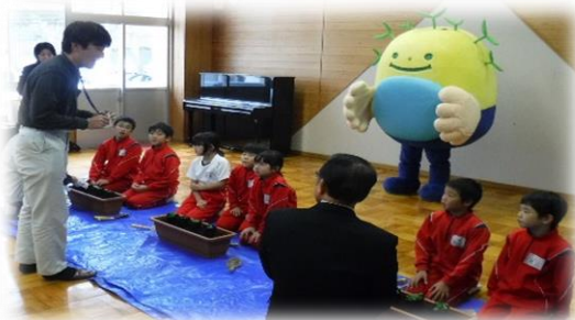
総合グリーンセンター職員による植栽方法の説明

福井市立殿下小学校の児童たちが、小学校で花苗を育ててもらった県のスクールステイ事業を利用してビオラの花苗100株を育てました。