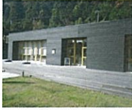
2 ハーバルビレッジ