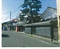
伝統的民家が並ぶ