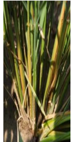
幼虫の食入による変色茎

越冬世代成虫の発生は平年よりやや早く、第一世代幼虫の発生も平年より早くなる予想です。育苗箱施薬でニカメイガに効果の高いフェルテラまたはプリンス箱粒剤を処理していない場合は、遅れないよう適期に防除を行いましょう。