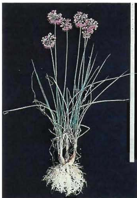
図1 オータムヴィオレの草姿

1) 1996年夏に1球植えで定植した株から種球を採取。秋植えは1997年に、春植えは1998年に親株を掘り上げて1球ずつ分離し、種球消毒後砂土に条間30cm、株間15cmで定植。春植えは分球が始まっていたが分球前の状態を1球とした。栽培管理はラッキョウに準じ、調査時期は1998年秋の開花期。