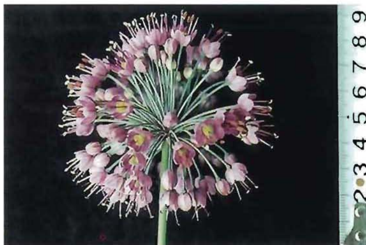
図3 オータムヴィオレの花球