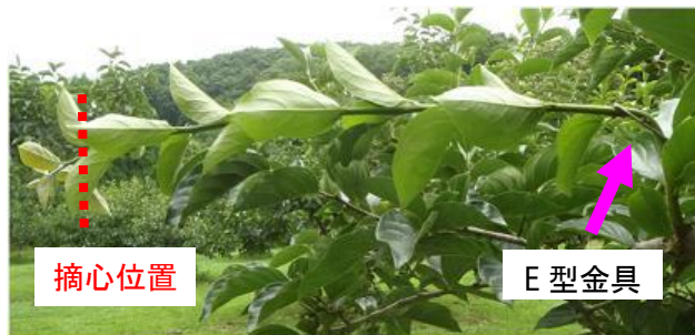
写真2 E型金具による徒長枝の側枝化