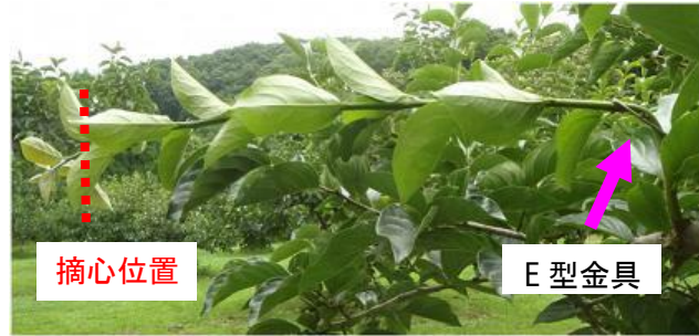
写真2 E型金具による徒長枝の側枝化