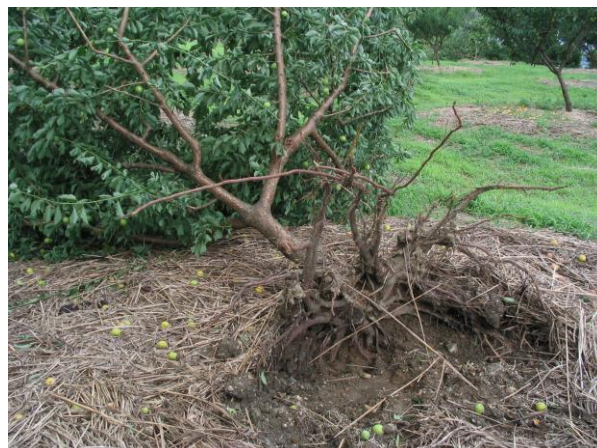
写真 強風によるウメ若木の倒伏

強風による倒木や主幹部の損傷を防止するために、支柱等により主幹を固定する。特に、幼木や根の浅い樹種は根こそぎ倒れやすいので注意する。また、枝の揺れによる果実の傷や落果を防ぐため、風当たりの強い部位の枝を中心に支柱の点検や設置、補強を行う。