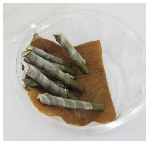
写真 調製した穂木

切接ぎを成功させるポイントは、①穂木を乾燥させずに低温で保存しておく、②樹液の流動が始まった時期に接ぐ、③穂木・台木ともに接着面が平滑になるように、穂木・台木を調製する、④穂木・台木の形成層(樹皮直下の養水分の通り道)がお互いに密着するように固定することである。