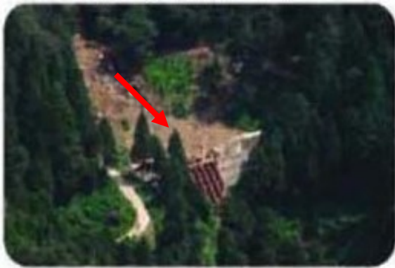
平成16年8月 土石流発生後

平成16年7月18日5:00～12:00にかけて、当該地区では梅雨前線に伴う集中豪雨（最大時間雨量85mm）により、土石流が発生しました。しかし砂防えん堤により流木・土砂を捕捉し、下流への被害の拡大を抑止する効果がありました。