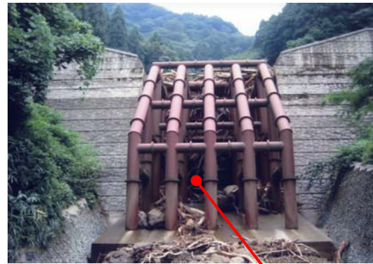
平成16年8月 土石流発生後