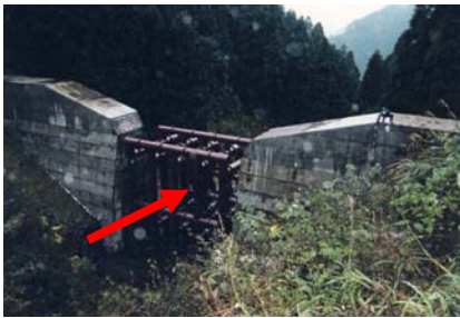
平成11年12月 土石流発生前