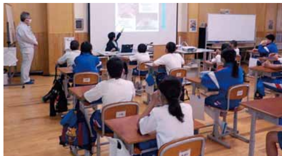
〔岡本小学校（越前市）〕