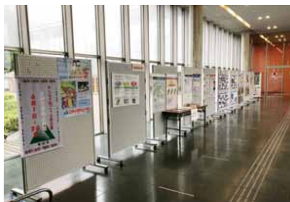
〔パネル展（県立図書館）〕

防災情報の入手方法や土砂災害警戒区域の確認方法、避難の考え方などのパネルを展示し、県民の皆さんに関心を持っていただけるようPRしました。