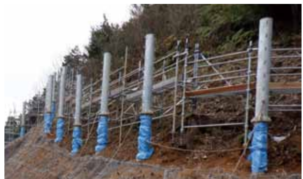
〔継続箇所：おおい町岡田（崩壊土砂防護柵工）〕