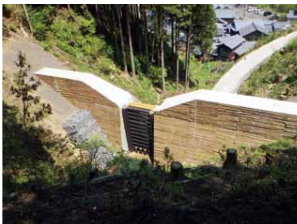
谷奥谷川 砂防堰堤 (南越前町赤萩) (令和2年度 完成)

令和2年度は、7箇所で行った事業を実施し、谷奥谷川(南越前町)、暮見地区(勝山市)、美の越川(若狭町)の3箇所が完成しました。