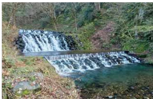
〔鬼谷川堰堤(大野市佐開)〕

これらの堰堤の保全と地域活性化を進めるため、令和3年度は、鬼谷川堰堤とアカタン砂防堰堤で福井県初となる砂防カードを大野市と南越前町が作成し、施設見学会などで配布する予定です。