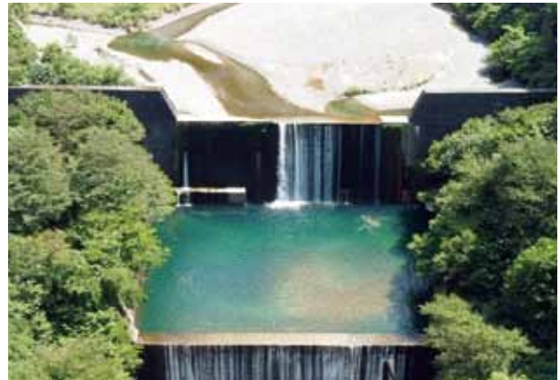
〔砂防堰堤の点検（ドローンにより撮影）〕

今後は、定期点検を進めながら、点検結果をもとに健全度評価および劣化予測等を行い、令和5年度末にはライフサイクルコストを考慮した長寿命化計画に改定する予定です。