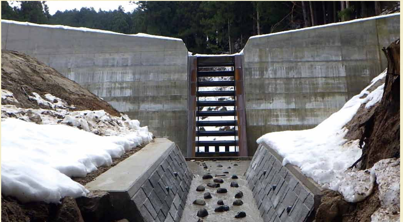
通常砂防事業〔サギ谷 たに 川砂防堰堤〕（大野市蕨生）