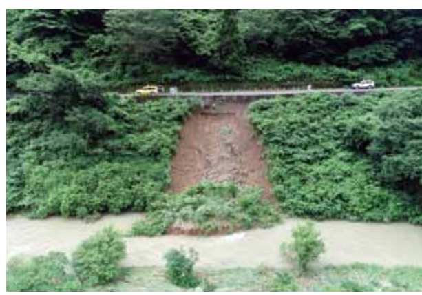
〔一般県道上小池勝原線（大野市下打波）〕