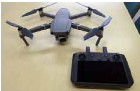
〔土木事務所に配備されたドローン〕