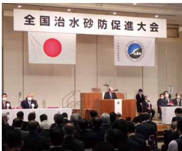
〔全国治水砂防促進大会〕

閉会後には当支部の活動として、会員等5名が参加し、議員会館において県選出国會議員に提言書を提出しました。