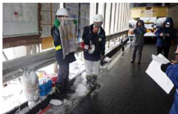
〔特別パトロール（大野市仏原）〕

また、12月16日、本格的な降雪期を前に、土木事務所、農林総合事務所、市、警察署、消防署が、合同で雪崩防止施設の点検等を行う特別パトロールを実施し、雪崩防災に努めました。