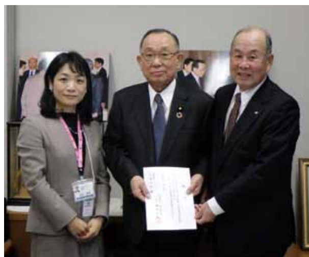
〔提言書提出 山崎正昭参議院議員へ〕