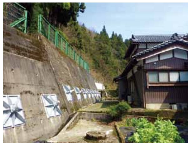
暮見地区 コンクリート擁壁補強 (勝山市村岡町暮見) (令和2年度 完成)