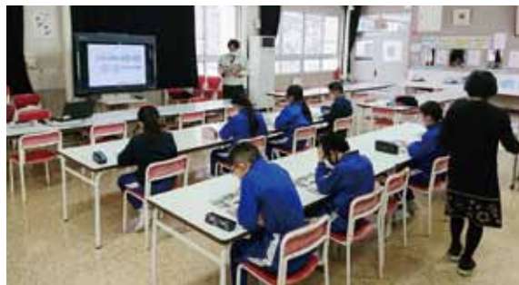
〔志比南小学校（永平寺町）〕