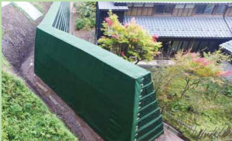
すぎたに 〔杉谷地区〕 (福井市杉谷町) 〔補強土防護擁壁工〕