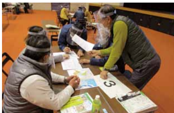
〔図上訓練(南越前町)〕