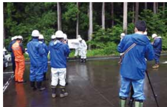
〔特別パトロール（大野市蕨生）〕

土木事務所、農林総合事務所、市町、警察署、消防署が、合同で土砂災害の危険性がある箇所をパトロールするとともに、住民に注意を呼びかけました。