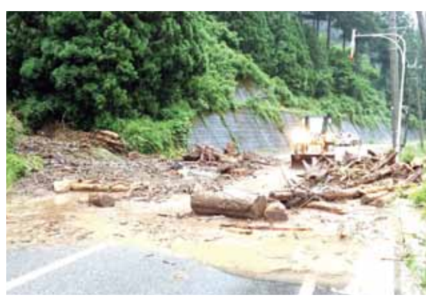
〔一般国道364号（坂井市丸岡町上竹田）〕

令和2年は、6月から7月の梅雨前線豪雨により、福井県内7市町で河川、砂防および道路施設などに被害をもたらしました。被災件数は16件と近年の中でも比較的少ない年となりました。