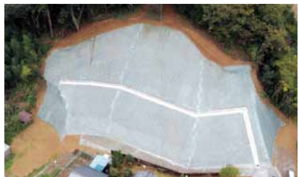
〔完成箇所：あわら市吉崎（切土工）〕

令和2年度は、3市1町の4地区でこの補助制度が活用され、吉崎第2地区（あわら市）の1箇所が完成しました。