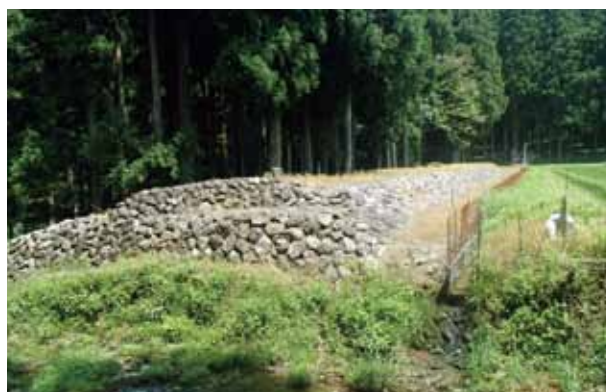
〔アカタン砂防九号堰堤(南越前町古木)〕