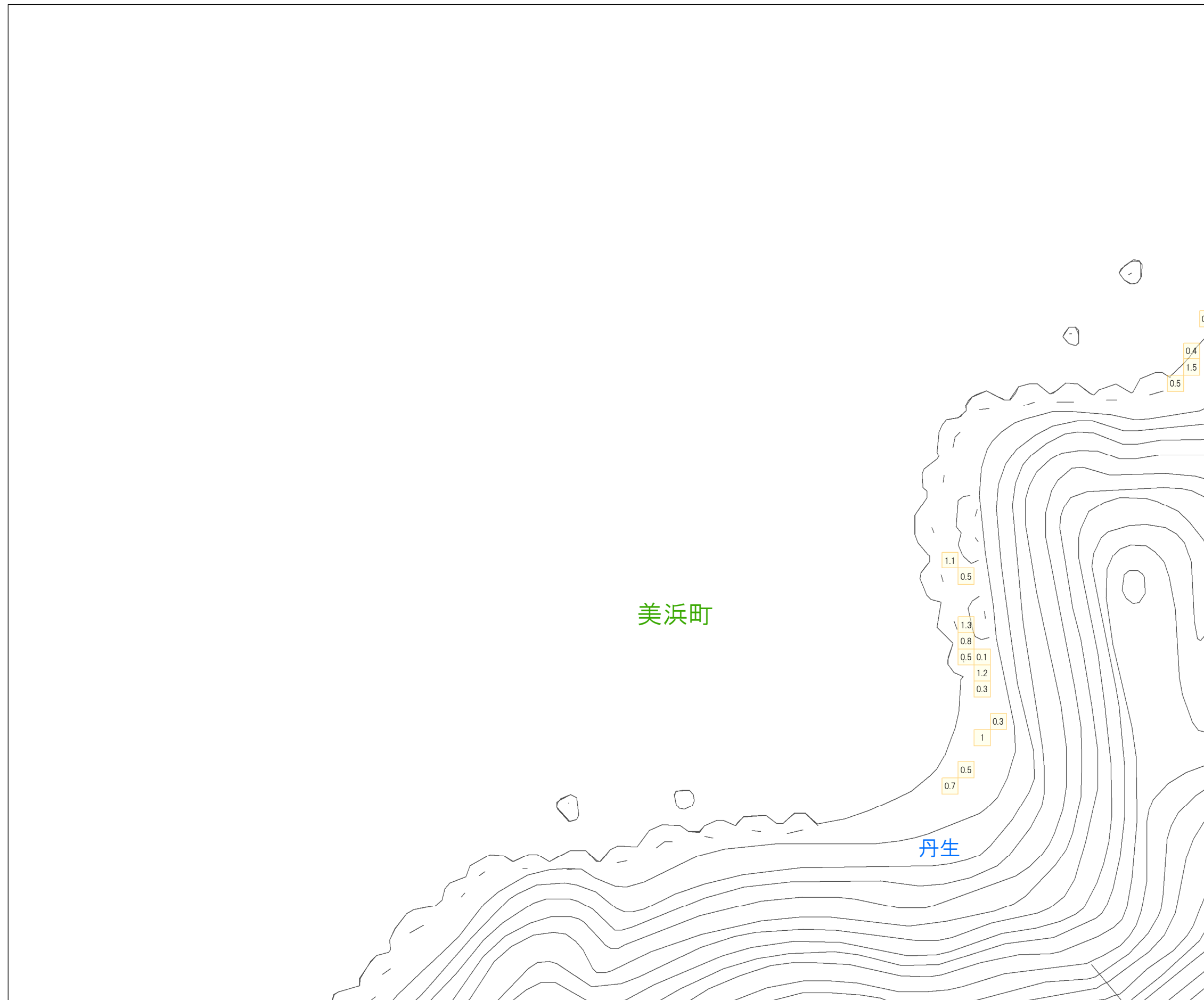
津波災害警戒区域 区域図