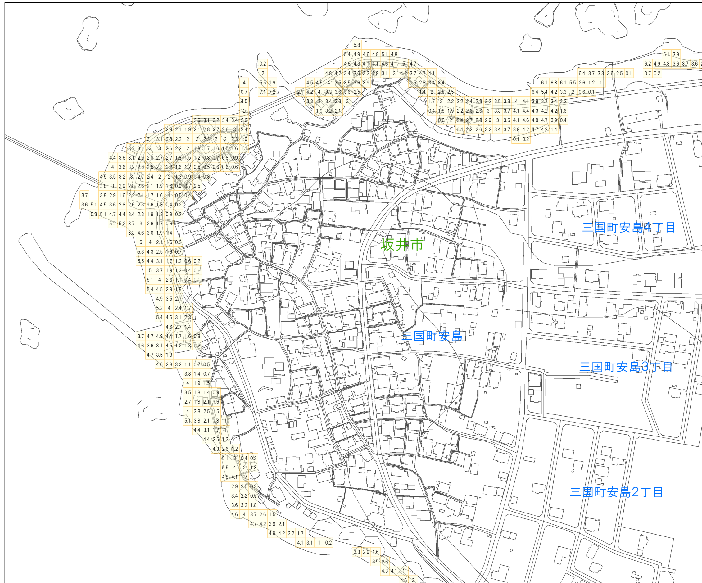
津波災害警戒区域 区域図