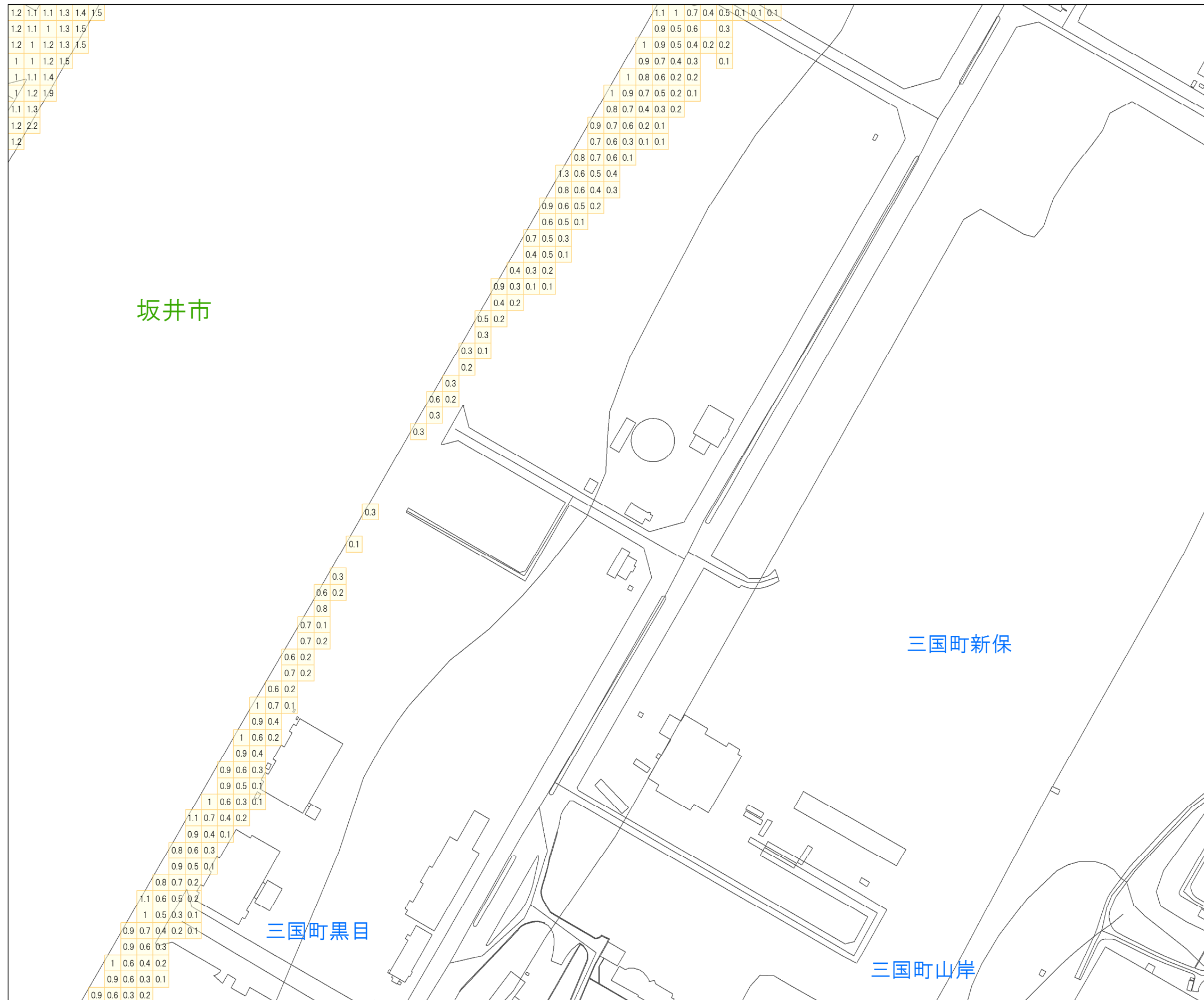
津波災害警戒区域 区域図